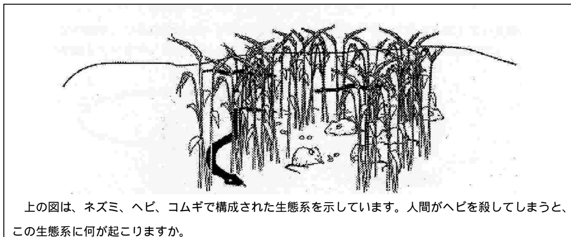
< 資料6 >